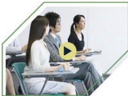
不動産広告の規約 説明動画(工事中)